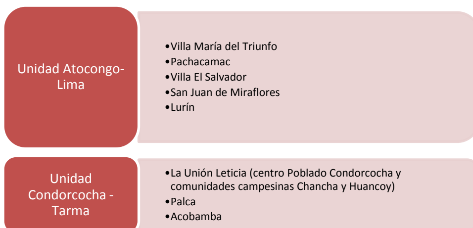
Gráfico N.º 5: Comunidad UNACEM