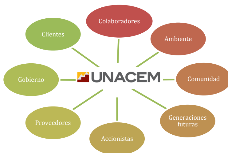
Gráfico N.º 3 Principales grupos de interés

Durante 2017 hemos continuado trabajando en una gestión sostenible, a través de la identificación y gestión de los impactos económicos, sociales y ambientales vinculados a nuestras operaciones. Además, a través de la Asociación UNACEM, canalizamos y potenciamos nuestros esfuerzos para fomentar el desarrollo de nuestras comunidades cercanas y de todos nuestros grupos de interés.